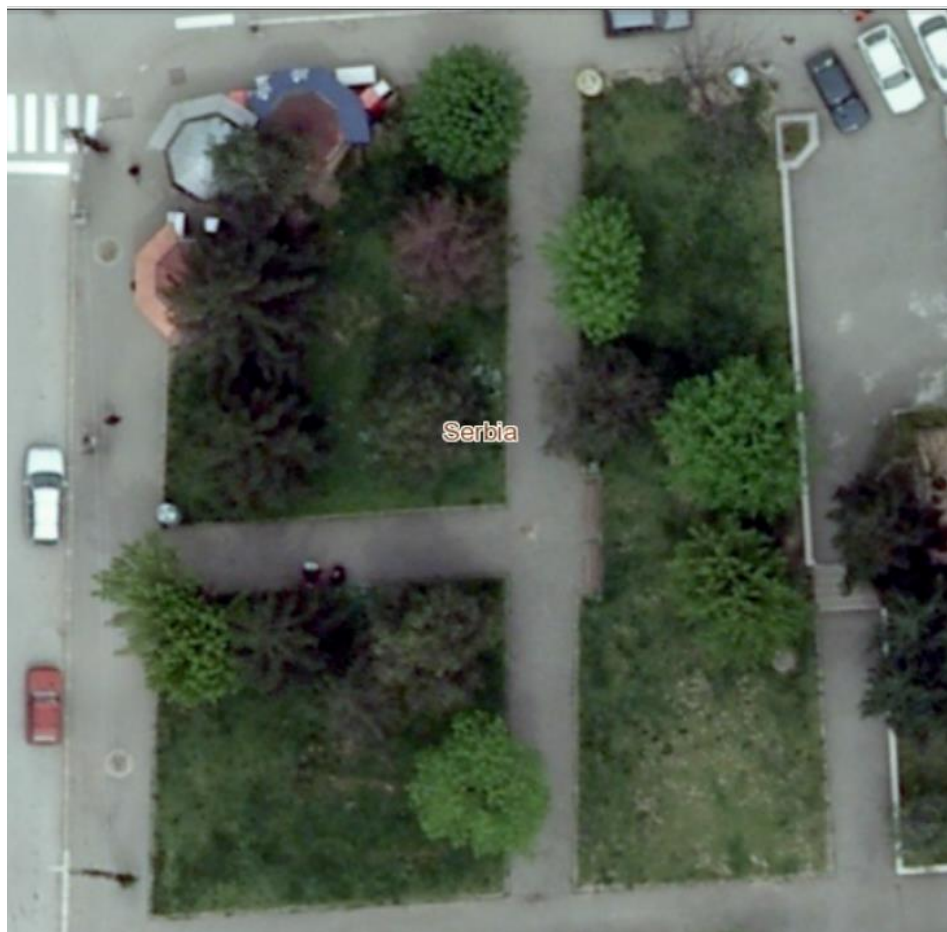
Сл.лоакција бр.4 (4а, 4б, 4в, 4г, 4д, 4е, 4з и 4и)