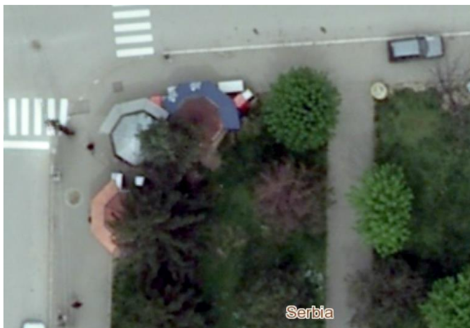
Сл.локације бр.1,2 и 3