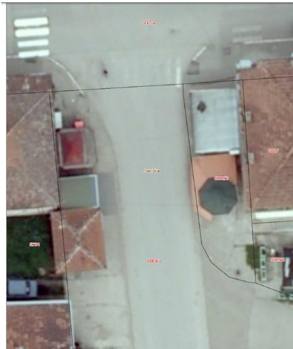
Сл.локације бр.5, 6 , 7, 8 и 9