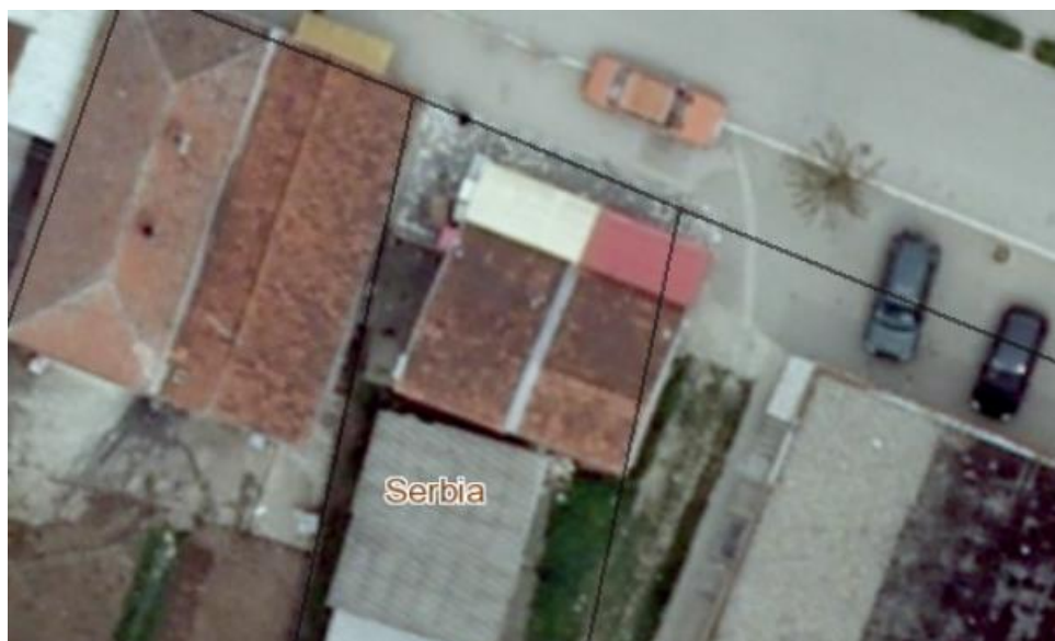
Сл.локације бр.11 и 12